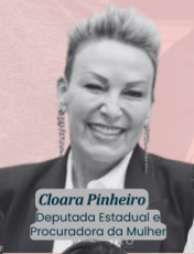
Cloara Pinheiro Deputada Estadual e Procuradora da Mulher